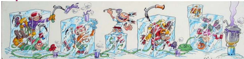
Joan-Mr B / Ice 07

Pour encore plus de promiscuité, dans un espace chaleureux et favorable aux échanges conviviaux